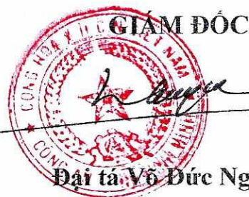
Đại tá Võ Đức Nguyên